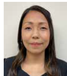
高田千明 さん 東京都港区在住 【主な出場大会】 2021年東京2020 パラリンピック競技大会 走幅跳5位入賞

◎上記3人のほか、ゲストランナーをさらに調整中です!! 決まり次第、大会公式サイト等でお知らせします!