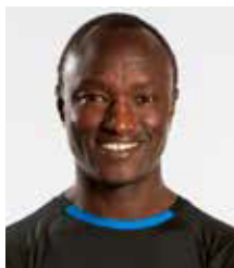
エリック・ワイナイナ さん ケニア出身 【主な出場大会】 2000年シドニーオリンピック銀メダル 2004年アテネオリンピック7位入賞